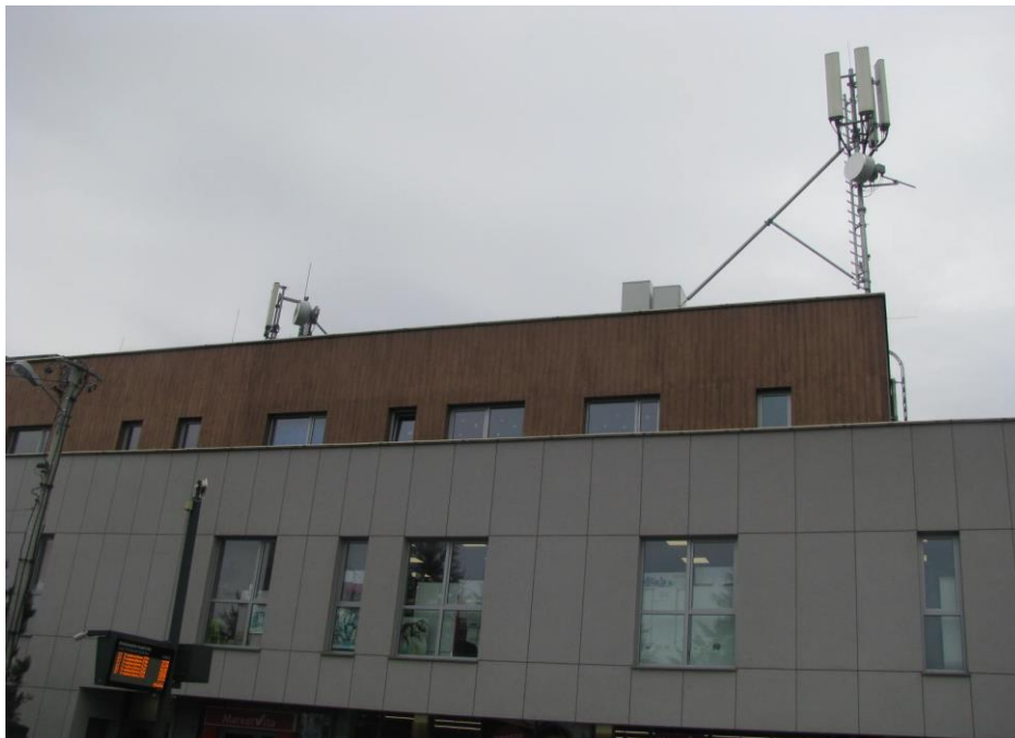
Zaf. nr 1: Widok ogólny instalacji radiokomunikacyjnej.