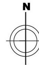
Azymuty anten T-Mobile